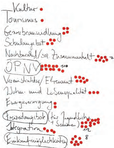
Bildung von Schwerpunktthemen

Zuerst wurden die Stärken und Schwächen sowie Chancen und Risiken in unseren Gemeinden beleuchtet. Hierbei wurde schnell klar, dass ein ganzheitliches Konzept für die Samtge-