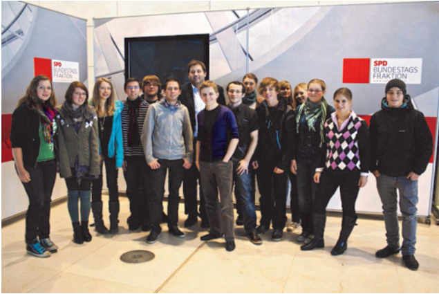
Jugendliche mit dem SPD-Bundestagsabgeordneten Lars Klingbeil

gend sowie mit dem gastgebenden Abgeordneten Klingbeil auf dem Tagesplan.