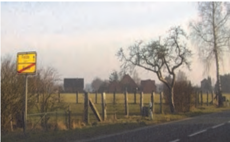
Hier ist es bald soweit! Im Sommer 2012 öffnet ein neuer Verbrauchermarkt an der Bremer Straße seine Pforten.

Im Sommer 2012 ist es soweit! Dann sind Planungs- und Genehmigungsverfahren, Baumaßnahmen und Pächtersuche voraussichtlich abgeschlossen und ein neuer Verbrauchermarkt öffnet in Riede seine Pforten. Für die SPD ist damit ein großer Meilenstein erreicht, auf dem Weg zur Erhaltung der Eigenständigkeit des Ortes einerseits und dem Entgegenwirken gegen die fortschreitende Zentralisierung in Thedinghausen andererseits.